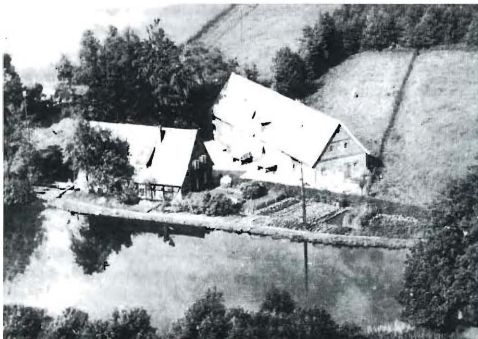
Obere Wassermühle mit Mühlenteich.