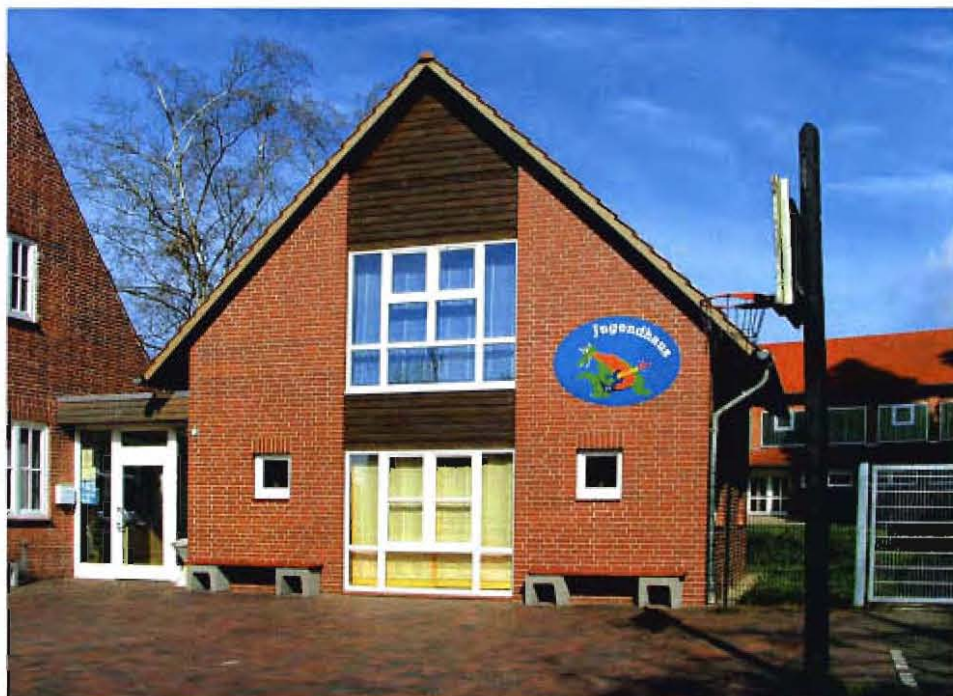
Direkt neben dem Asendorfer Gemeindehaus und der Grundschule steht das Jugendhaus. Der freundliche Bau lädt zahlreiche Jugendliche zum Faulenzen und Spaß haben ein.

für die Besucher. Neben dem gemütlichen Küchenbereich als Herzstück des Hauses stehen den 13- bis 18-jährigen im Erdgeschoss ein Billardtisch und ein Kicker zur Verfügung.