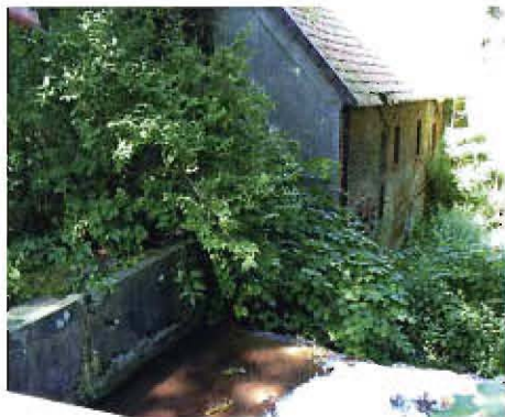
Flotbettbrücke der unteren Wassermühle.

Die Obere Mühle befindet sich „Am Dobben“ und die Untere Mühle an der Grauer „Mühlenstraße“. Bei den Mühlen handelte es sich um ober-schläch-tige Wassermühlen, d. h. das Wasser floss vom Flotbett direkt oben auf das Mühlenrad. Anfang des 19. Jahrhunderts gingen die Grauer Mühlen in Privatbesitz über. Den Betrieb der Unteren Mühle legten die Besitzer 1942 still, als der Müller im zweiten Weltkrieg fiel.