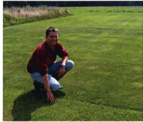
Verschiedene Rasenmischungen für unterschiedliche Ansprüche.