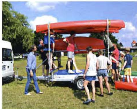
Vater und Kind-Tour mit dem Kanu auf der Oertze