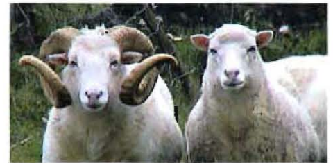
Masurische Skudden, eine bedrohte Tierart.

auf dem jeder seine Sachen verkaufen kann. Anbieter für den Bauernmarkt oder den Flohmarkt können sich unter folgender Rufnummer anmelden: Peter Henze, 04253/92011. Weitere Veranstaltungen auf dem Hof Arbste 7 finden bereits am 16. und 17. September statt. Da führen die Spieler des „Theater Henze & Co.“ das Stück „De ole Buur un sin Öko Deern“ auf. „Ein Stück Leben für Erwachsene und Jugendliche in hochdeutsch und en beten platt“, verspricht Peter Henze.