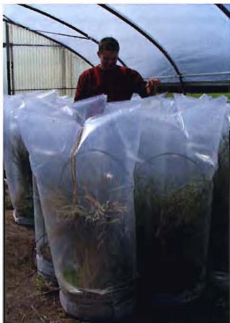
Zum Schutz vor fremden Pollen kommen gekreuzte Pflanzen in so genannte Isolierkabinen.

Die DSV entwickelt daher Sorten, die möglichst viele Ertrags-, Qualitäts- und Resistenzeigenschaften in sich vereinen. Von der Entwicklung bis zum Verkauf einer Pflanzensorte vergehen bis zu zwanzig Jahre.