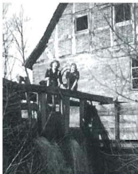
Die Obere Mühle mit der Flotbettbrücke 1953.