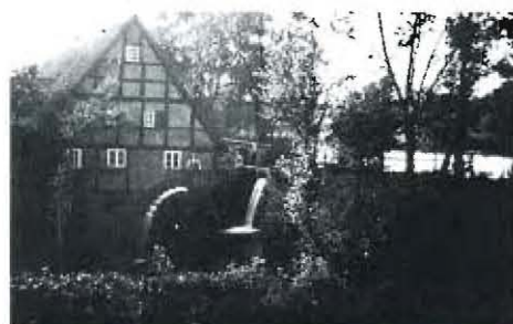
Die obere Mühle um 1948. Der Betrieb wurde aufgrund enormer Schäden durch Hochwasser und Deichbruch 1958 eingestellt. Letzter Müller war Friedrich Ellinghausen.