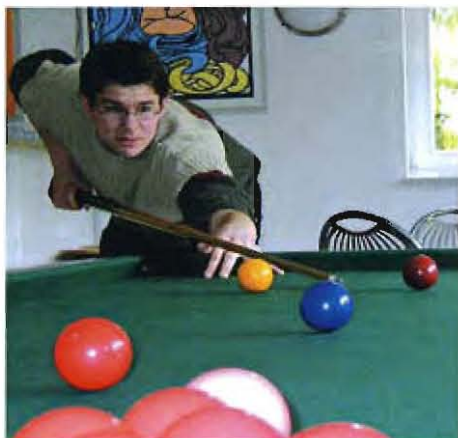
Der Billardtisch hat sich bezahlt gemacht, „der läuft hier richtig heiß und ist den ganzen Tag besetzt“.

Die großzügigen hellen Räume erlauben Rückzugsmöglichkeiten und vielfältige gleichzeitige Beschäftigungsmöglichkeiten