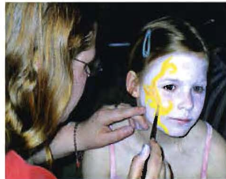
Schminken auf dem Erdbeermarkt im Jugendzelt

Montags und freitags ist bis 18.00 Uhr, dienstags bis Donnerstags bis 20.00 Uhr geöffnet. Fragen beantwortet Hans-Werner Weber unter folgender Rufnummer: 04253/584.