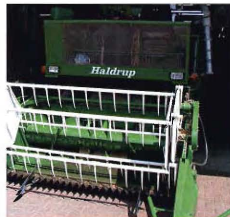
Die DSV benötigt Spezialmaschinen für die Ernte der kleinen Pflanzenparzellen.

Heutzutage ist die Pflanzenzüchtung mit moderner Wissenschaft und Technik verbunden, mit vielen Universitäten und landwirtschaftliche Institute bestehen enge