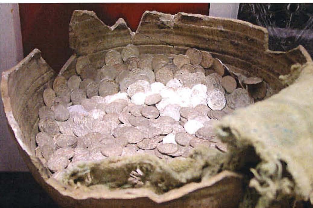
Der Silberschatz in seinem Tongefäß wie er im Heimatmuseum ausgestellt und zu besichtigen ist

Oft hat es sich ergeben, dass Erzählungen und Sagen von alten vergrabenen Schätzen, die von Generation zu Generation mündlich überliefert wurden, auf wirkliche Begebenheiten zurückgingen. Das Sagenmotiv hat Schatzgräber und Wissenschaftler veranlasst, den Spaten anzusetzen - nicht immer mit Erfolg. Nicht selten förderte auch der Zufall einen Schatz zutage, von dem bisher niemand etwas wusste.