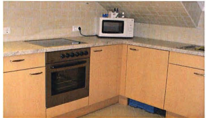
Küche - Ein wichtiger Raum, klein aber funktionell