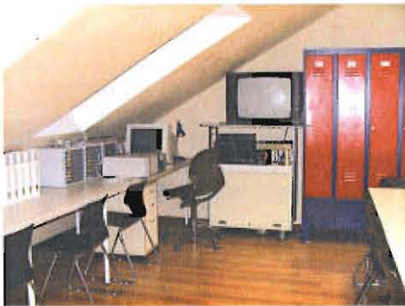
Jugendfeuerwehrraum mit technischer Ausstattung

–männer auch die Möglichkeit, gleich nach dem Einsatz zu duschen, um z. B. sofort wieder an ihren Arbeitsplatz zurückkehren zu können – die Arbeitgeber werden es ihnen danken.