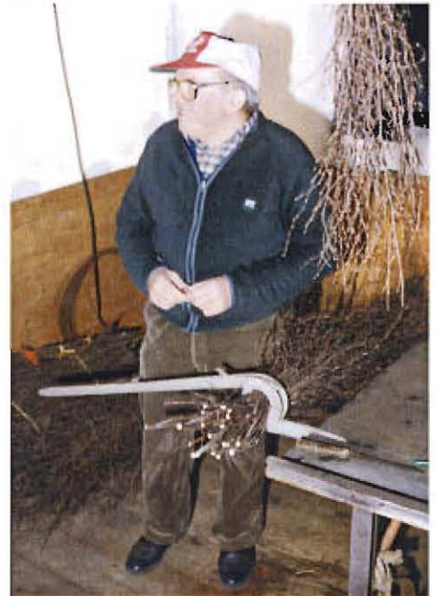
Auch das alte Handwerk, wie z.B. ein Besenbinder, ist vertreten