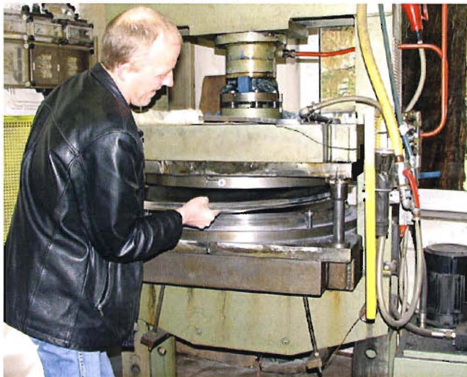
Die Schüsseln bekommen ihre endgültige Form

Für vielversprechend halten Stelter und Löhmann das digitale terrestrische Fernsehen (DVB-T). Weil es die wichtigsten Sender in bester Qualität - ganz einfach über Antenne mit einem Zusatzgerät - liefert. „arcon“ ist auch hierfür gerüstet und bietet ein DVB-T-Empfangsgerät an. Eine echte Alternative zum Satellitenfernsehen ist DVB-T aber nicht, meint Stelter. „Satellitenanlagen sind ein beratungsintensives