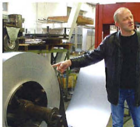
Aluminiumrollen - Ausgangsmaterial für die Satellitenempfangsanlagen