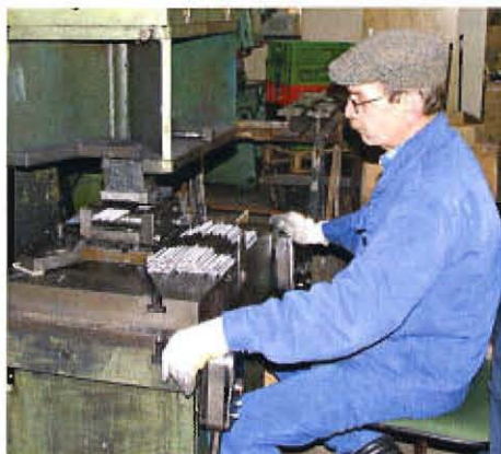
Zubehörteile werden in Form gebracht

Satelliten-TV heute für eine einmalige Investition von wenigen hundert Euro über tausend Sender aus aller Welt in hervorragender Bild- und Tonqualität.