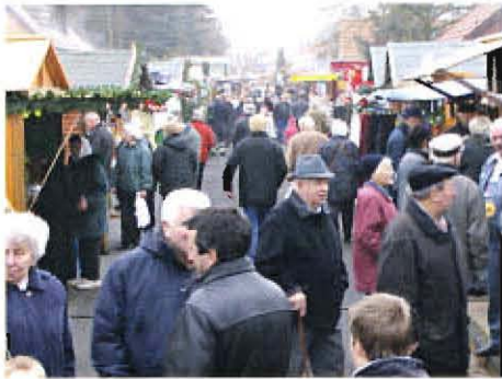
Dichtes Gedränge an den Buden in der Weihnachtsmarkt-Meile