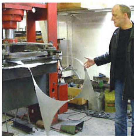
Ausstanzten der Grundform

Im Gegensatz zum dünnen Angebot von 3 Programmen in den Gründerjahren bietet