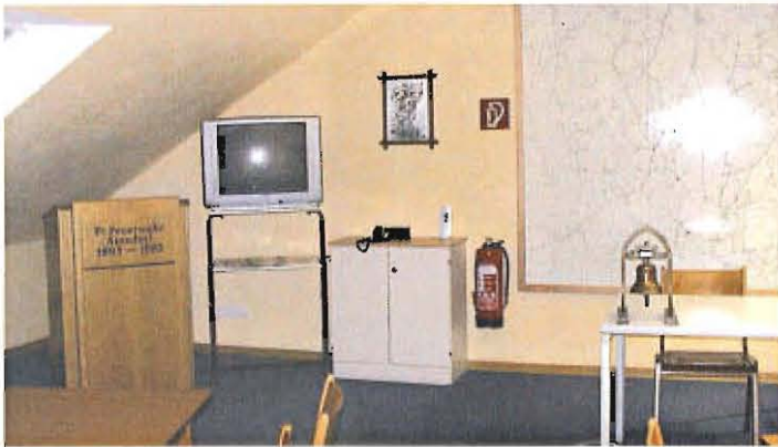
Schulungsraum - Für die Ausbildung technisch perfekt ausgerüstet