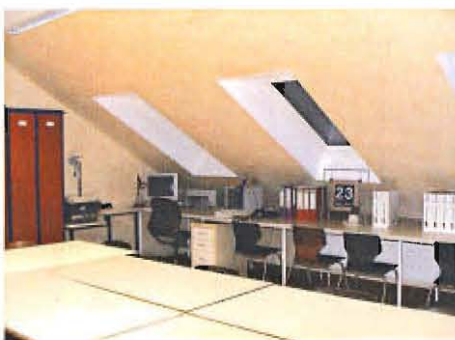
Jugendfeuerwehrraum mit genügend Platz zum Basteln etc.

In seiner Eröffnungsrede betonte Hans Ullmann noch einmal, dass durch den Bau dieses Feuerwehrhauses die Zukunft der ehrenamtlichen Arbeit der Feuerwehr in der Gemeinde Asendorf und in Samtgemeinde gesichert wird. Wenn es den Feuerwehrleuten dann auch noch Freude macht in ihr Haus zu gehen, eine bessere Einsatzbereitschaft gewährleistet ist und auch die Ausbildung des Nachwuchses aus der Jugendfeuerwehr verbessert werden kann, dann hat sich dieser enorme Aufwand doch gelohnt. Aber trotz allem, einige Dinge sind auch noch weiter in der Planung, wie z. B. das Carport für den Mannschaftsbus des Fördervereins der Feuerwehr. Uns bleibt nur zu hoffen, dass das Haus sowenig wie möglich für Einsatzzwecke benutzt wird.