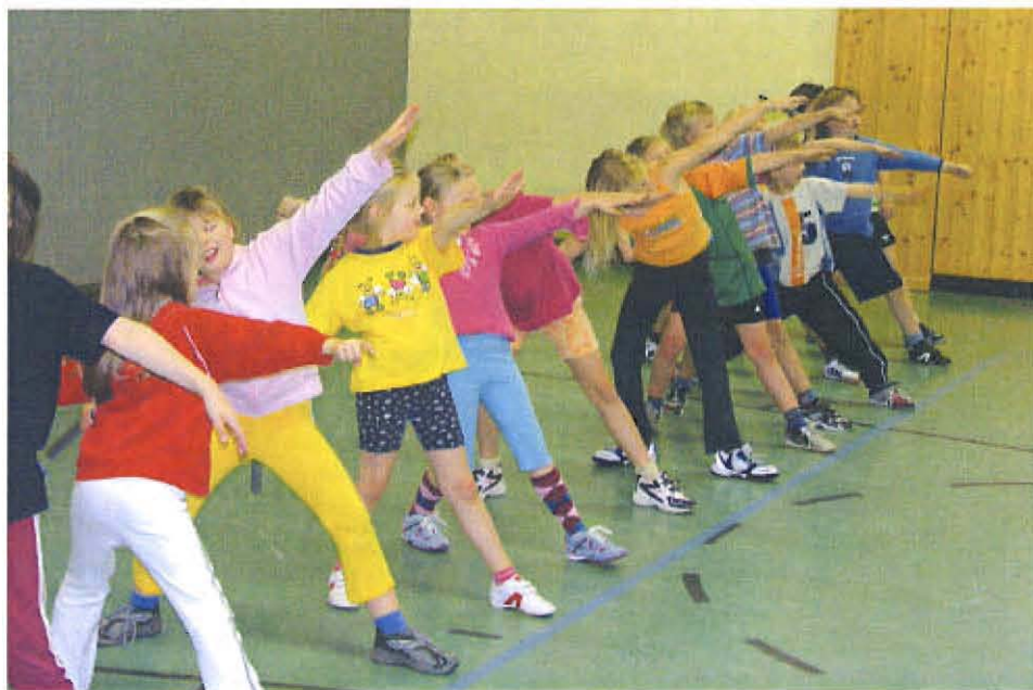
Offensichtlich macht es den Kindern Spaß ihre sportlichen Leistungen zu trainieren und vorzuführen

Eines der größten Anliegen der Leichtathletikgruppe des TSV Asendorf besteht sicherlich darin, Kindern und Jugendlichen die Möglichkeit zu bieten, sich in ihrer Freizeit sportlich zu betätigen. Dabei legt der Verein besonderen Wert auf die konditionelle, koordinative, sowie technisch-spezifische Entwicklung der Teilnehmer.