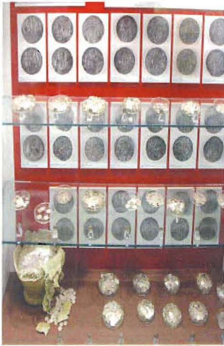
Dieses Bild zeigt den gesamten Münzfund, der auch heute noch im Heimatmuseum in Syke ausgestellt und während der Öffnungszeiten zu besichtigen ist.

mittelalterlichen Tongefäßen umher. Trägt man den Fundort in eine alte Landkarte ein, dann wird ganz deutlich, dass er im Zuge des alten Heerweges liegt, der von Barrien aus durch das Friedeholz, an Schnepke, Kreuzlage, Legenhausen und Vilsen vorbei zu dem Weserübergang bei Sebbenhausen führte. Dieser alte Weg ist durch Funde über Jahrtausende hin belegt. An beiden Seiten des Weges sind zu allen Perioden Gegenstände vergraben worden. Zur Frage: „Wem mag dieser Schatz gehört haben; wer versteckte ihn und warum wurde er vergraben?“ liefert der ehemalige