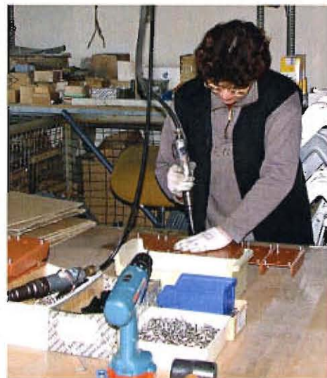
Endmontage der Befestigungen

Arcon GmbH im Leistungsspiegel markt intern: 1. Platz für Fachhandelsausrichtung (Kein Direktverkauf) 2. Platz Gesamtergebnis