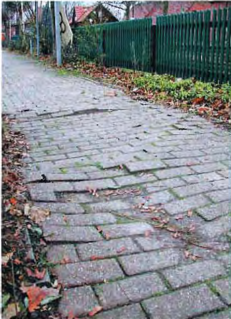
Gehweg am Bahnhof eine Stolperfalle

ständige Pflege und Unterhaltung führt hier zum Ziel. Ein kleiner Riss in der Asphaltdecke gefährdet die Verkehrssicherheit nicht, bietet Feuchtigkeit und Frost aber eine ideale Angriffsfläche. Die Risse formen sich auf den Straßen zu spinnenartigen Gebilden aus, Wasser dringt ein, der Winter bringt Frostaufbrüche mit sich, der Verkehr führt dazu, dass dann die Spalten zunehmend breiter werden. Die Risse müssen deshalb möglichst frühzeitig durch Splittarbeiten geschlossen werden. Angesichts der Länge der Straßen und der fiesen Tatsache, dass die Risse nicht geballt an einer Stelle einer Straße auftreten, sondern sich raffiniert über das Wegenetz verteilen, eine zeit- und personalintensive Arbeit, die entsprechende Kosten verursacht. In den vergangenen Jahren testete die Gemeinde hier den Einsatz von Schüler-Ferienjobs, um mit den zur