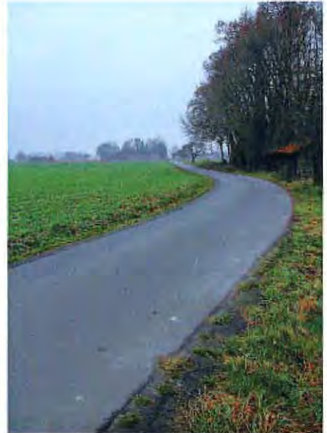
Arbste: in den letzten Jahren erneuert

Je nach Bauart und Beanspruchung geben Experten einer befestigten Straße eine Lebensdauer von 40 bis 50 Jahren. Bei einem Wegenetz von 150 Kilometern und einer angenommenen Lebensdauer von 50 Jahren müssten in Asendorf deshalb regelmäßig 3 Kilometer pro Jahr erneuert werden. Die erforderlichen Baukosten von rund 300.000 Euro gibt der Haushalt der Gemeinde aber seit Jahren nicht her. In den vergangenen 6 Jahren wurden in den Außenbereichen