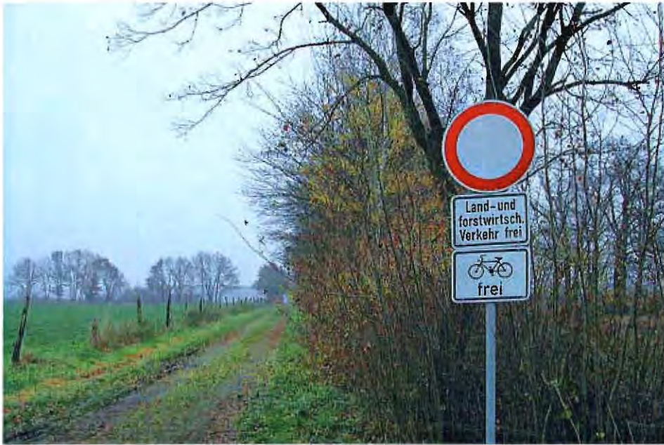
Durchfahrt verboten. Zukünftig häufiger anzutreffen?

Die Gemeinde Asendorf wird erschlossen von einem umfangreichen Netz von öffentlichen Gemeindestraßen. Insgesamt verfügt die Gemeinde über rund 150 Kilometer eigener Straßen.