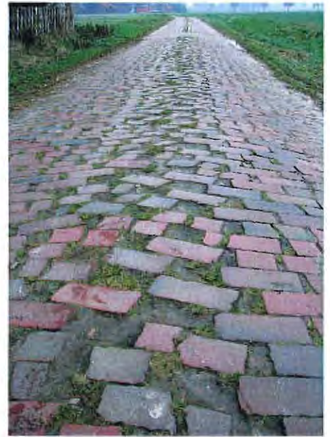
Schäden durch schwere Fahrzeuge

Die Gemeinde hat entsprechend ihrer Leistungsfähigkeit die Straßen so zu bauen, zu unterhalten, zu erweitern oder sonst zu verbessern, dass sie dem regelmäßigen Verkehrsbedürfnis genügen. Bei einem Wegenetz mit 150 Kilometern keine leichte,