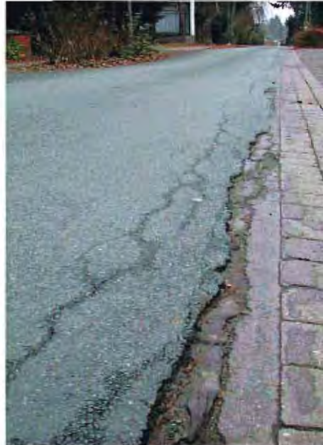
Seitenabbrüche in der Bahnhofstraße

ständige Pflege und Unterhaltung führt hier zum Ziel. Ein kleiner Riss in der Asphaltdecke gefährdet die Verkehrssicherheit nicht, bietet Feuchtigkeit und Frost aber eine ideale Angriffsfläche. Die Risse formen sich auf den Straßen zu spinnenartigen Gebilden aus, Wasser dringt ein, der Winter bringt Frostaufbrüche mit sich, der Verkehr führt dazu, dass dann die Spalten zunehmend breiter werden. Die Risse müssen deshalb möglichst frühzeitig durch Splittarbeiten geschlossen werden. Angesichts der Länge der Straßen und der fiesen Tatsache, dass die Risse nicht geballt an einer Stelle einer Straße auftreten, sondern sich raffiniert über das Wegenetz verteilen, eine zeit- und personalintensive Arbeit, die entsprechende Kosten verursacht. In den vergangenen Jahren testete die Gemeinde hier den Einsatz von Schüler-Ferienjobs, um mit den zur