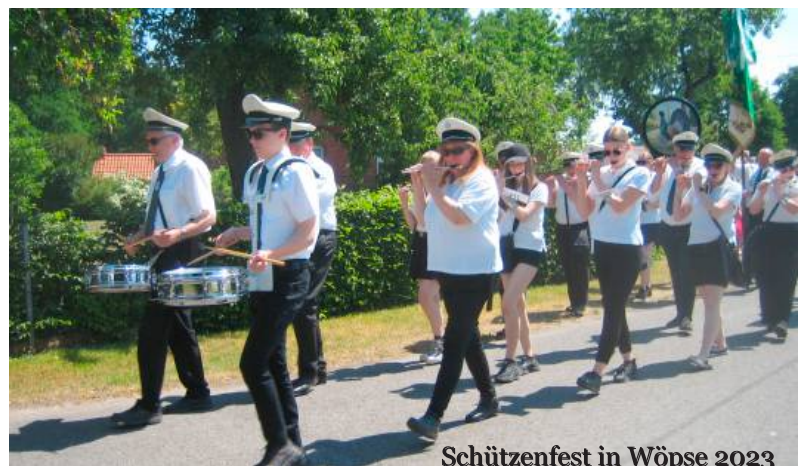
Schützenfest in Wöpsse 2023

Jetzt die Frage: Was erhalte ich dafür? „Spaß, Solidarität, Ausbildung, Gemeinschaftsveranstaltungen und