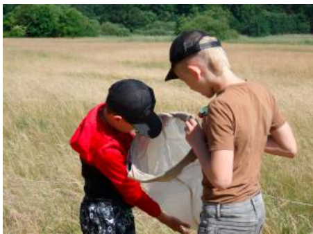
Was haben wir für Insekten gefangen?

Die Drittklässlerinnen und Drittklässler verschlug es nach Rotenburg/Wümme. Bei bestem Sommerwetter konnten wir die Innenstadt bei einer Rallye kennenlernen. Eine lange