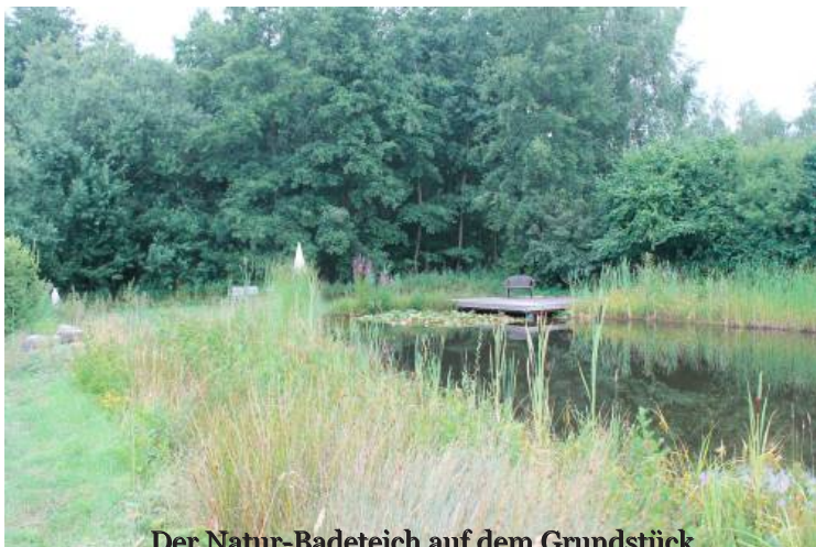
Der Natur-Badeteich auf dem Grundstück

Hierbei ist es möglich, dass der Präsenzkurs von der Krankenkasse bezuschusst wird.