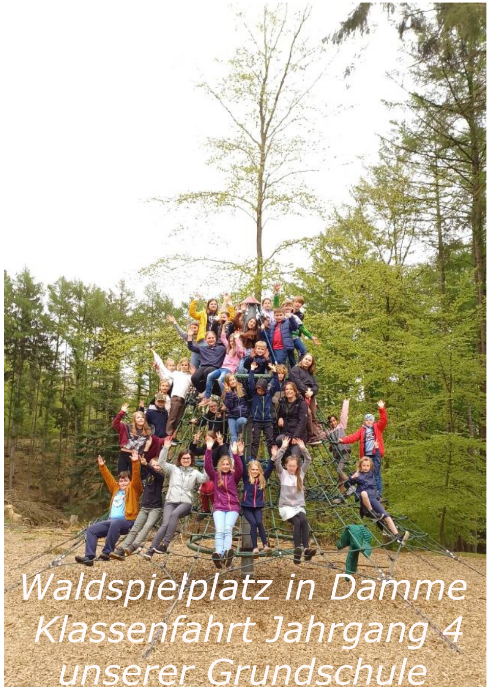
Waldspielplatz in Damme Klassenfahrt Jahrgang 4 unserer Grundschule