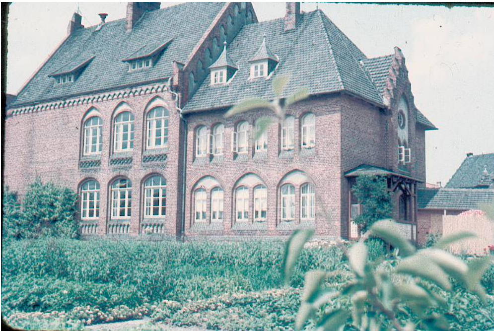
Das Schulgebäude aus einer anderen Perspektive