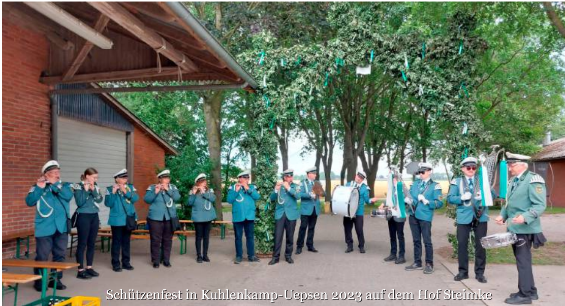
Schützenfest in Kühlenkamp-Uepsen 2023 auf dem Hof Steinke

Musik verbindet und begeistert. Das war bereits vor 60 Jahren so. Zu der Zeit, am 6. März 1963, wurde der Spielmannszug Asendorf auf der Generalversammlung des Schützenvereins Asendorf e.V. - quasi als Abteilung des Schützenvereins - gegründet. Damit wurde verhindert, dass doppelte Vereinsstrukturen bestehen. Die Spielleute können sich somit auf das Musizieren konzentrieren, ohne auch noch über vereinsinterne Prozesse und Regularien nachdenken zu müssen. In dieser Form existiert der Spielmannszug bis zum heutigen Tage.