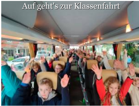
Auf geht's zur Klassenfahrt

Auch wir haben es gewagt: Wir haben unsere Klassenräume verlassen und sind aufgebrochen in die weite oder auch nahe Welt.