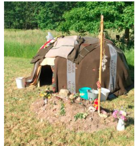
Schwitzhütten-Rituale Eine Zeremonie als intensives Reinigungsritual -ebenfalls ein Angebot auf dem Hof-

Weitere Details insbesondere zu Kursen und Seminaren gibt es unter www.hof-chaitanya.de und können auch telefonisch erfragt werden unter 04272-9595645 oder mobil unter 0179-1330019.