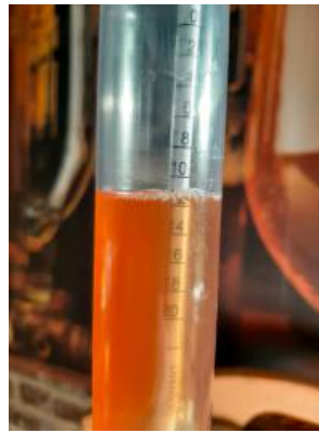
Die Stammwürze: mit entscheidend für die Biersorte

durfte Stefan bis zum Ende des Jahres 2024 steuerfrei 200 l Bier erzeugen. Ausschließlich für den privaten Gebrauch - kein Verkauf. Dies war dem Zoll jährlich vorab zu melden. Seit dem 1.1. diesen Jahres sind es 500 l. Wird mehr erzeugt, ist die Menge dem Zoll anzuzeigen und Biersteuer zu zahlen. Für stichprobenartige Überprüfungen durch den Zoll sollten Aufzeichnungen vorgelegt werden können, wieviel Bier gebraut wurde.