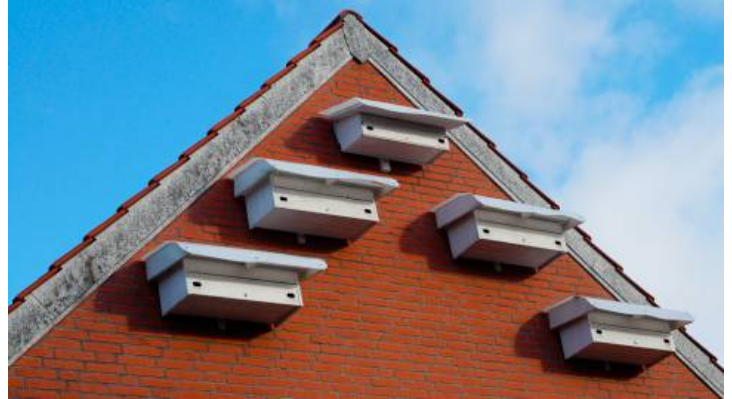
Nistkästen im Steinweg

Warum ist der Mauersegler hier einen Bericht wert? Nun, Asendorf ist eine Hochburg für Mauersegler.