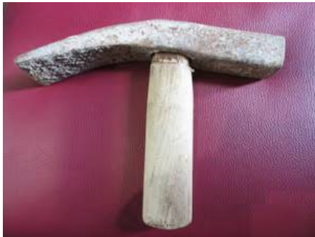
Handwerkszeug der Steinsetzer: Pflasterhammer aus den 50-iger Jahren

Dieser Hammertyp ist speziell an die Arbeiten beim Pflastern angepasst. Der Pflasterhammer besteht aus einem Hammerkopf und einem besonders kurzen Stiel.