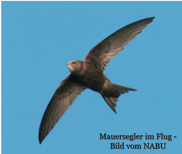
Mauersegler im Flug

Anfang Mai sind sie wieder da. Der Mauersegler ( Lateinisch: Apus apus ) kehrt aus seinen Winterquartieren in Afrika zu uns zurück. Sie sind schnell, faszinierend, selten, stehen unter besonderem Schutz und läuten mit ihren schrillen Rufen für viele Menschen in unserer Region den Sommer ein. Bis Anfang August erfreut der Mauersegler uns dann wieder mit seinen Flugkünsten am Himmel über Asendorf und zieht hier seine Jungen auf. Als Brutplatz benötigt er Spalten in Gebäuden im Sims oder unter den Dachpfannen, gerne werden auch spezielle Nistkästen angenommen.