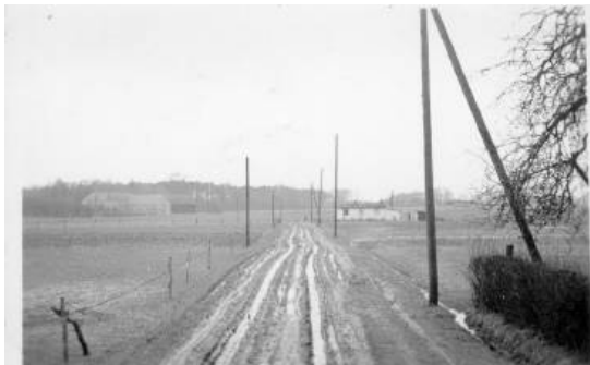
Arbste-Niederwald: Blick Richtung Scholen - Hohenholzer Weg

Die Straßen unserer Gemeinde in den 50er-Jahren waren mehr als nur Verkehrswege – sie erzählen Geschichten von Schlaglöchern, Gemeinschaftsgeist und der Entwicklung von einfachen Wegen hin zu befestigten Verbindungen. Holz, Sand und Kies waren die frühen Materialien, aus denen die Verkehrswege bestanden. Viele von ihnen sahen damals noch so aus wie auf den beigefügten Bildern.