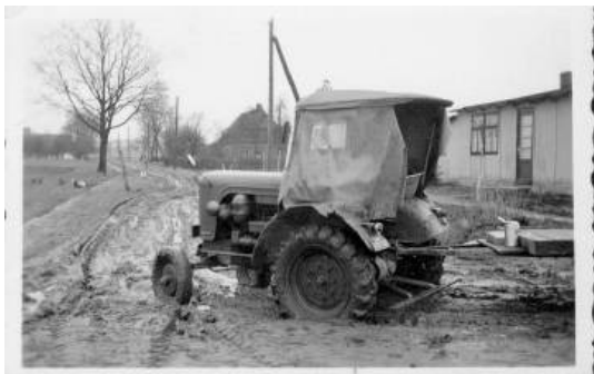
Trecker auf dem Weg zur Molkerei wühlt sich durch den Schlamm