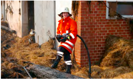
"fix und fertig" - Einsatz am 7.6. 2007

Heute haben sich die Feuerwehrfrauen in allen Richtungen etabliert.