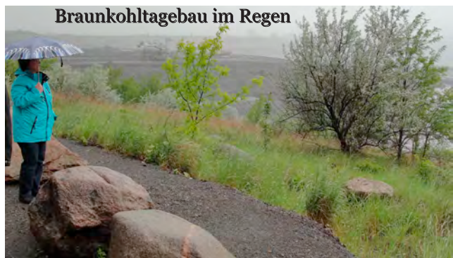
Braunkohltagebau im Regen

hinterläßt bis heute der Braunkohlentagebau. Auch Asendorfer Gebiet ist betroffen. Allerdings ist 1998 auf einer Abraumhalde das Naturschutzgebiet „Asendorfer Kippe“ entstanden. Z.T. äußerst seltene Pflanzen-, Insekten- und Vogelarten haben seitdem die bis zu 80m hohe Abraumhalde erobert. Von ihr bietet sich ein beeindruckender Blick auf den Tagebau.