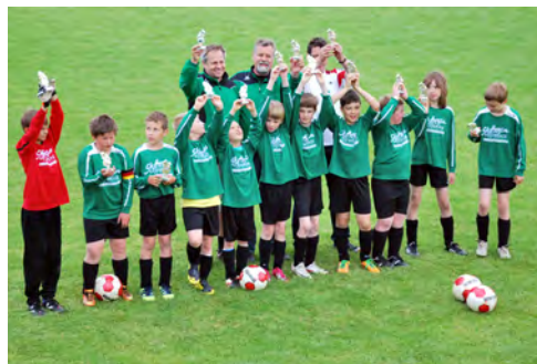
Die jubelnde Meistermannschaft E1-Junioren