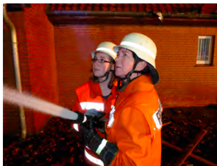
Im Einsatz am 9.11. 2012

Gleichzeitig war es natürlich notwendig, die Ausbildung zur Feuerwehrfrau zu absolvieren. Ein Erste-Hilfe-Lehrgang und der Grundlehrgang wurden in Angriff genommen und gemeistert. Für die monatlichen Dienste wurde die Gruppe den drei Zügen zugeteilt. Es gab keine Extrawurst für die Frauen, sie mussten ebenso wie die Männer ihren Dienst leisten. Diese Integration in den Zügen förderte die Akzeptanz und es bildete sich eine gute Zusammenarbeit und Kameradschaft, die bei den Einsätzen unbedingt erforderlich ist.