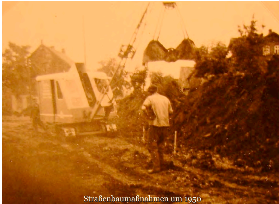
Straßenbaumaßnahmen um 1950

Der Wegebau ist auch heute bei den Diskussionen um die Flurbereinigung ein gewichtiges Argument, da die Erhaltung der vielen Wege Geld kostet, das bei der Flurbereinigung zu großen Teilen vom Staat bezahlt wird. Früher wie heute werden bei Bau und Erhaltung der Wege zu großen Teilen die Gemeindegossen belastet. Wenige aber erinnern sich noch daran, dass bis zur Gemeindeform Anfang der siebziger Jahre des letzten Jahrhunderts die Gemeindegossen zu Hand- und Spanndiensten verpflichtet waren.