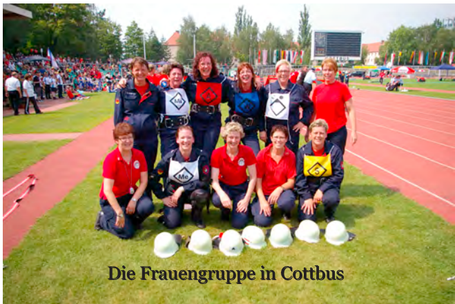
Die Frauengruppe in Cottbus

Genau am 04. April 1983, einem Ostermontag, standen sechs Frauen auf dem Sportplatz bereit, um auszuprobieren, ob der Gedanke eine Frauengruppe für den Traditionellen Internationalen Wettbewerb zu gründen, auch umsetzbar ist.