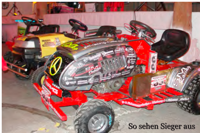
So sehen Sieger aus

ennah und leicht modifiziert beschreiben mag. Sie können z.T. sogar noch mähen.