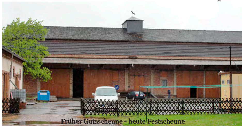
Früher Guttscheune - heute Festscheune

Die vier Pfingsttage sind eine große Gemeinschaftsaktion des Ortes, das Rennen der abschließende Höhepunkt. Der Pfingstverein zeichnet sich besonders verantwortlich für die Tage davor. Seine Pfingstburschen erfüllen die Aufgabe, den Ort zu Ehren des Festtags zu schmücken. Die Bewohner werden begrüßt, die Pfingstburschen ziehen von Haus zu Haus, "Maien" - also Birken oder Birkenzweige - wer-