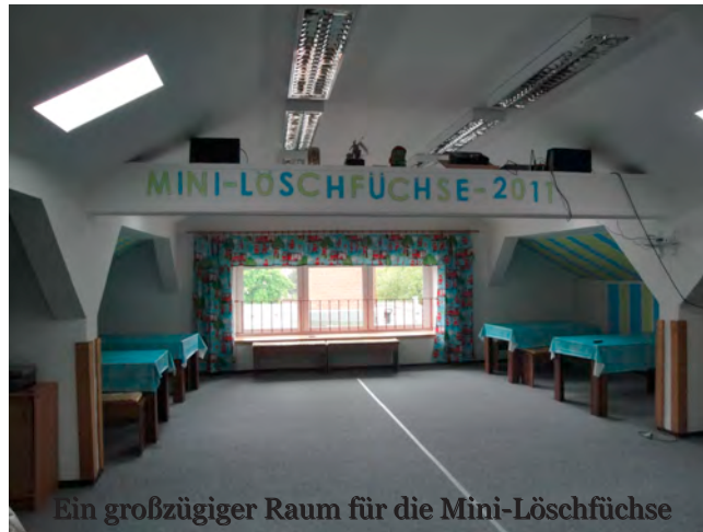
Ein großzügiger Raum für die Mini-Löschfüchse

Im ehemaligen Schulgebäude, mitten im Ortskern belegen, befindet sich nun ein starkes und jüngst noch ausgebaut Kinderbetreuungsangebot. Krippe (bis drei Jahre), Kindergarten (drei bis sechs Jahre) und der Hort sind unter einem Dach untergebracht. Im Hort wird Betreuung bis ca. 18 Uhr angeboten, was nach dem Schulmittagessen auch die Grundschüler einschließt.