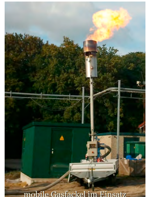
mobile Gasfackel im Einsatz

Matthias Allhusen konstruierte für diese Einsätze komplett betriebsbereite mobile Heizzentralen, die er in PKW-Anhängern und Containern einbaute - Tankanlage inklusive.