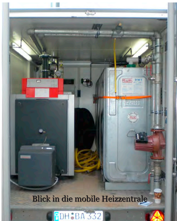
Blick in die mobile Heizzentrale

Im vierten Jahr der Selbständigkeit befindet sich mittlerweile Matthias Allhusen, gelernter Landwirt. Er hatte sich nach der einjährigen Fachschule außerlandwirtschaftlich orientiert. Die Ausbildung zum und die Tätigkeit als Groß- und Außenhandelskaufmann schlossen sich an.