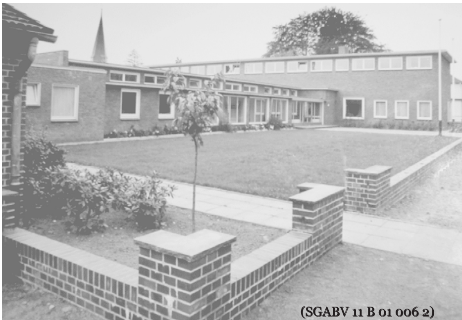
(SGABV 11 B 01 006 2)