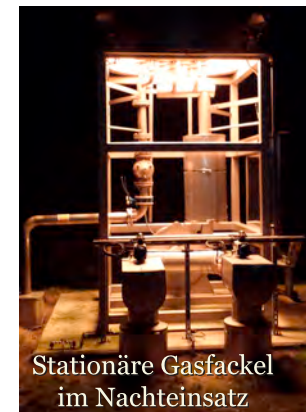
Stationäre Gasfackel im Nachteinsatz