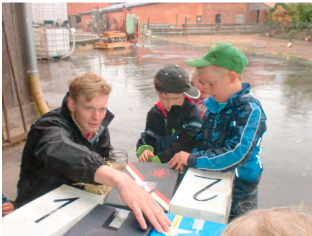
Mit dem Tastsinn fühlen, forschen und begreifen

Die Asendorfer Landfrauen organisierten die Busfahrt zu den Betrieben, begleiteten uns an diesen Tagen und hatten verschiedene Erlebnisstationen bei den Betrieben vorbereitet: Fühlkästen, Malaktionen, Ausstellungen und kleine Betriebsführungen zu Fuß oder mit dem Trecker wurden organisiert.