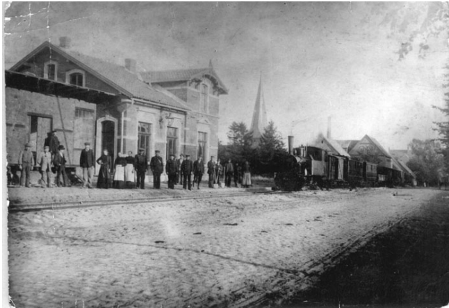
Abfahrt am Asendorfer Bahnhof

Tatsächlich bekamen wir einige Wochen später einen Brief mit der Aufforderung, zum Gerichtstermin beim Amtsgericht in Hoya zu erscheinen. Am Tag der Gerichtsverhandlung musste ich bereits früh aufstehen.