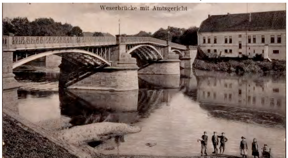
Die Weserbrücke mit dem Amtsgericht.

Aus Platzgründen lesen Sie hier die verkürzte Form. Den vollständigen Text finden Sie unter www.asendorf.info in der Rubrik AsendorfPress.