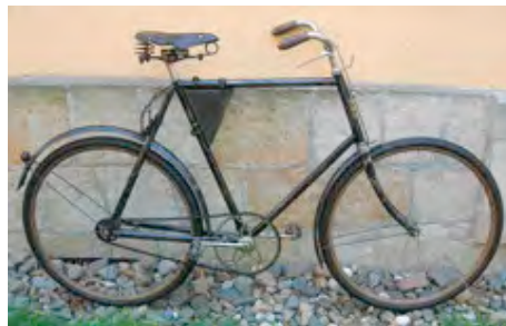
Ein Fahrrad um 1900

begegneten, musste er dicht an mir vorbei. Als dann der Mann mit seinem Fahrrad an mir vorbei war, blieb ich stehen und schaute mich zu ihm um. Ob er dies bemerkt hatte oder auch nicht, sei dahin gestellt. Auf jeden Fall blieb auch er stehen und drehte sich so halb nach mir um. Dadurch war es mir möglich, sein Gesicht länger zu sehen und mir einzuprägen, wie er angezogen war. Denn zu der Zeit war es ungewöhnlich, einen fremden Mann hier im Ort mit einem Fahrrad anzutreffen, welches dann auch noch von ihm geschoben wurde. Besitzer eines Fahrrades zu sein, war in der damaligen Zeit außergewöhnlich und etwas ganz besonderes. Nur wenige aus dem Ort konnten ein Fahrrad ihr Eigen nennen.