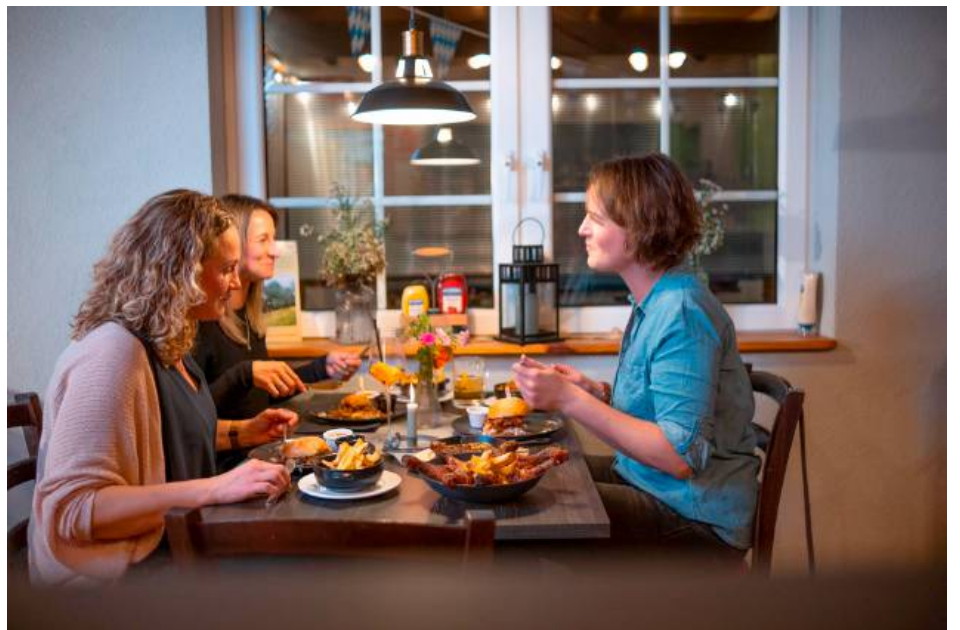
Geselligkeit, Beieinandersitzen und Schnacken