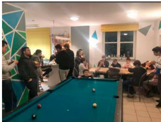
Gemeinsam Pizza essen zum Jahresabschluss

Da die Schulgemeinschaft das Jugendhaus am Vormittag nutzen darf, können die Kinder und Jugendlichen am Nachmittag sich auf dem Schulhof mit „Fußballkäfig“ oder ab und zu auch in der Turnhalle austoben.