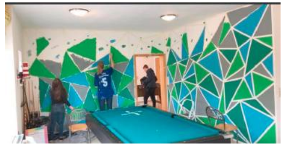
Neue Farbe fürs Jugendhaus

In diesem Jahr sind mehrere Ausflüge geplant. Durch eine großzügige Spende ist es möglich, den Kindern und Jugendlichen tolle Aktionen und