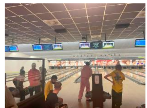
Ausflug ins Bowlingcenter

Das in wenigen Jahren aufgebaute Netzwerk zwischen Schule, Jugendhaus, Kirche, Gemeinde oder Fachdienst Jugend wissen alle Beteiligten zu schätzen. Die kurzen Wege, sowohl in realen Schritten als auch im schnellen Austausch zwischen den Institutionen, sind Gold wert und kommen letztendlich den Kindern und Jugendlichen zugute.