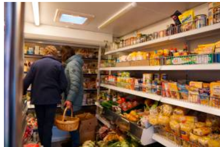
Einkauf im rollenden Supermarkt

und dann ca. 15.00 Uhr Am Posthof vor dem Grundstück Heinen. Die angegebenen Zeiten können auf Grund unterschiedlicher Kundenfrequenz und -verweildauer variieren. Das Motto ist nämlich: Unkompliziert und ganz ohne Hektik einkaufen.