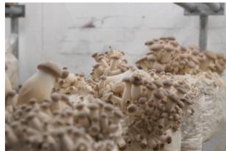
Der milde Austernseitling und der herzhaft Kräuterseitling sind derzeit im Angebot