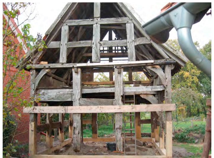
Entkernter Fachwerkspeicher in Uenzen

werden auch nicht irgendwelche Fachwerkgrößen verändert. Es wird wirklich versucht alles wieder so herzustellen, wie es vor 200 Jahren oder länger