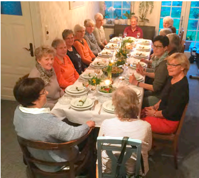
Die Dienstagsrunde in gemütlicher Atmosphäre

Die Dienstagsrunde beteiligt sich auch bei anderen Veranstaltungen des Heimatvereins, z.B. beim Erdbeermarkt, mit selbstgebacken Kuchen.