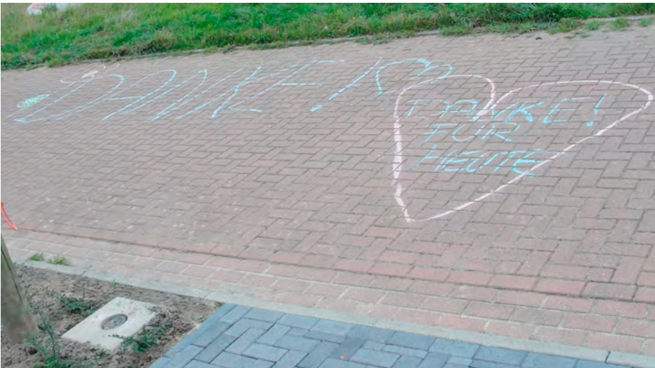
Das "Dankeschön" der Kinder nach einem Straßenfest

Nachbarschaft - oder sie sehen nicht die entsprechende Notwendigkeit. Doch wie soll die Nachbarschaft von heute und morgen aussehen?