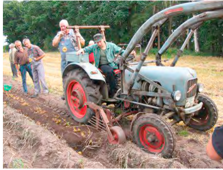
historischer Erntetag in Hohenmoor