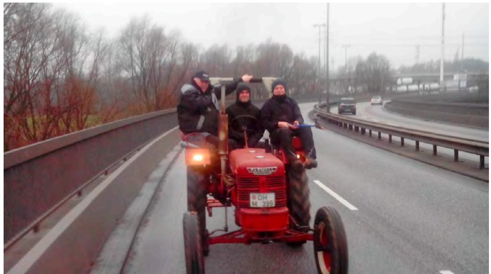
Früh am Neujahrsmorgen im Nebel auf der Köhlbrandbrücke

Ein außergewöhnlicher, sehr spontaner Spaß ist auch die Fahrt mit alten Treckern über die Hamburger Köhlbrandbrücke zum Jahreswechsel gewesen. Zusammenhalt garantiert ein 14tägiger Rundbrief.