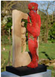
Eine Skulptur des Künstlers Uwe Oswald

Der Kunstverein ARTES-Asendorf e.V. wird am 27.- 28. Mai und am 03.-05. Juni 2017 jeweils von 11.00 Uhr bis 18.00 Uhr wieder ein besonderes Fest feiern. Der 5000 qm große Park von Alex und Marita Otterpohl in Asendorf-Kuhlenkamp, Vor den Bahnen 2, verwandelt sich zum 5. Skulpturenpark.