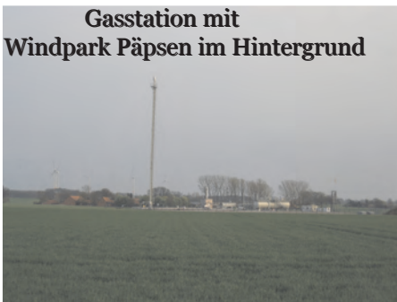
Gasstation mit Windpark Päpsen im Hintergrund

Staffhorst Nord Z2 ist eine von fünf Sauer gasbohrungen im Feld Staffhorst. Als Sauer gas wird ein Erdgas bezeichnet, das Anteile von Schwefelwasserstoff ( H_2S ) und/oder Kohlendioxid ( CO_2 ) enthält. Schwefelwasserstoff ist ein farbloses, brennbares, im Gemisch mit Sauerstoff explosionsfähiges Gas. Es ist etwas schwerer als Luft und löst sich in Wasser. Noch auf den Bohrplätzen wird das Gas grob aufbereitet. Es wird getrocknet, d.h. das Wasser wird abgeschieden. Die bei der groben Aufbereitung ebenfalls anfallenden nicht brauchbaren Gase (Brüden gas) werden vor Ort abgefackelt. So wird auch eine Geruchsbelastigung durch den Schwefelwasserstoff, dessen Geruch an den von verfaulten Eiern erinnert, vermieden. Diese sogenannten Fackeln haben aber auch eine zusätzlich Sicherheitsfunktion. Im Störfall können über sie auch Gase abgeleitet werden. Nach der ersten, groben Aufbereitung wird das Gas der einzelnen Bohrungen weiter zum Betriebsplatz Staffhorst in Borstel