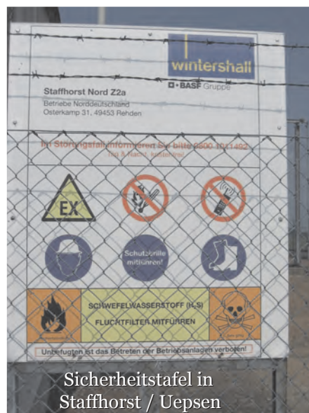
Sicherheitstafel in Staffhorst / Uepsen