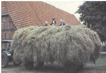
Der Wagen ist vollgeladen und wohlbehalten am Hof angekommen

War das Schnittgut ausreichend getrocknet, wurde es von Hand auf den Erntewagen geladen und zum Hof gefahren. Aber wann war es ausreichend getrocknet? Mit der Sinnenprobe und ein wenig Erfahrung wurde festgestellt, ob es ausreichend trocken ist: Dazu wurde an mehreren verschiedenen Stellen der Wiese eine Portion Heu in die Hand genommen und die Halme geknickt. Wenn die Halme dabei hörbar knacken, das Heu würzig riecht und eine appetitliche grüne Farbe aufweist, ist das Heu bereit zum Einfahren. Am Hof angekommen ging die schweißtreibende Arbeit weiter. Das