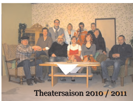
Theatersaison 2010 / 2011