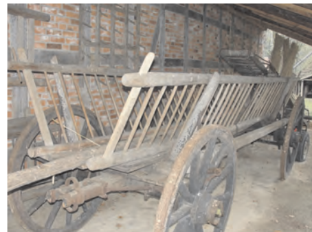
Leiterwagen für den "Ernteeinsatz" - ausgestellt im Heimatmuseum in Syke

Die Anderen mussten mit der Sense mähen und von Hand wenden. Dafür wurden sehr viele Arbeitskräfte benötigt, so dass sich die benachbarten Familien häufig untereinander aushalfen. So waren damals bei der Heuernte alle Generationen vertreten - von den Kindern bis zu den Großeltern - jede Hand wurde gebraucht. Ein Arbeitstag konnte dann schon gegen 4 Uhr morgens beginnen. Bis gegen 10 Uhr wurde das taufeuchte Gras mit der Sense gemäht. Anschließend wurde das gemähte Gras auseinander gezogen und von Hand mit Heugabeln zum Trocknen ausgebreitet. An den nächsten zwei bis drei aufeinander folgenden Tagen war es die Arbeit der Frauen und Kinder das Heu umzuwenden. Bei schlechtem Wetter musste das mehrmals täglich