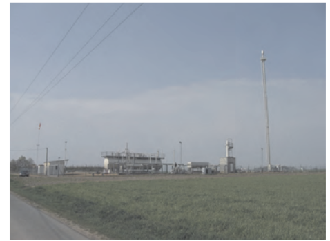
Blick von der Barkloger Str. aus

Von Juni 1973 bis Februar 1974 fand die erste Bohrung statt. Damals war das angewandte Verfahren noch, bis zum Erreichen des Trägers (der gasführenden Gesteinsschicht) ausschließlich senkrecht zu bohren. Eine Neubohrung von April bis Mai 1998 wurde dann als sogenannte Richtbohrung durchgeführt. Dabei wird die Bohrung abgelenkt, d.h. der Bohrkopf so gesteuert, daß das Bohrloch die letzten 300 m fast waagrecht ist. Die Erschließung des Gasfeldes erfolgt so von der Seite, was anschließend u.a. auch ein im