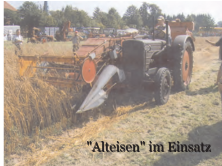
"Alteisen" im Einsatz

In der Planung ist ein Beginn gegen 9.30 Uhr mit der Eröffnung im alten Reitstallgebäude. Neben den Begrüßungsansprachen ist an eine gekürzte Fassung der Filmvorführung über die Asendorfer 900-Jahrfeier gedacht. Musikalische und (oder) künstlerische Darbietungen sorgen für kurzweiligen Ablauf. Im Anschluss daran ist ein Gottesdienst (evtl. Andacht) geplant. Es folgen danach Angebote für Jung und Alt. Innen- und Aussenbereiche des Eichenhofes werden für Aussteller und Versorgung genutzt. Handwerk-, Kunst- und Pflanzenmarkt wechseln