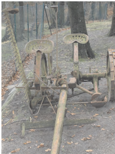
Mähmaschine mit Pferdedeichsel - ausgestellt im Heimatmuseum in Syke

Zwar gab es schon um 1930 die ersten von Pferden gezogenen Mähmaschinen, aber nur die wohlhabenden Landwirte konnten sie sich leisten.