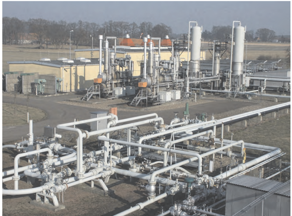
Gassammelstation in Borstel

Zehn Arbeitskräfte sind von der Sammelstation in Borstel aus für das Feld Staffhorst zuständig. Sechs von ihnen gewährleisten in kontinuierlicher Schicht eine 24-Stunden-Präsenz. Die weiteren vier setzen sich aus Schichtführer und Schlossern zusammen. Der Förder-