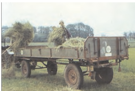
Heuernte in Uepsen

Ein Bericht von Fredi Rajes – Die Idee zu diesem Bericht kam durch die Bilder von Frederik Gissel - Details zu diesem Bericht wurden mir auch in meinen letzten Gesprächen genannt, die ich mit meiner am 15.4. 2011 verstorbenen Mutter führte. - Ihr widme ich diesen Bericht.