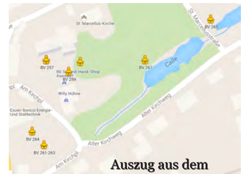
Auszug aus dem Kataster

Ja, und wer macht die Arbeit der Erfassung und Listung? Für die Gemeinde Asendorf hat sich dabei der Ortsverein des DRK eingeschaltet. Es erfolgt eine Zusammenarbeit mit dem VVV in Bruchhausen-Vilsen. Dort wird die Gesamtliste für unsere Samtgemeinde erstellt. Aus Sicht des DRK-Ortsvereins ist der Hauptbeweggrund, dass die Rettungsleitstelle des Landkreises Diepholz nach einem Notruf über 112 den genauen Standort der Bank über die GPS-Daten hat, falls der Rettungsdienst auf Grund eines Unfalles oder eines anderweitigen Unglücksfalles einen Patienten in freier Natur auffinden muss.