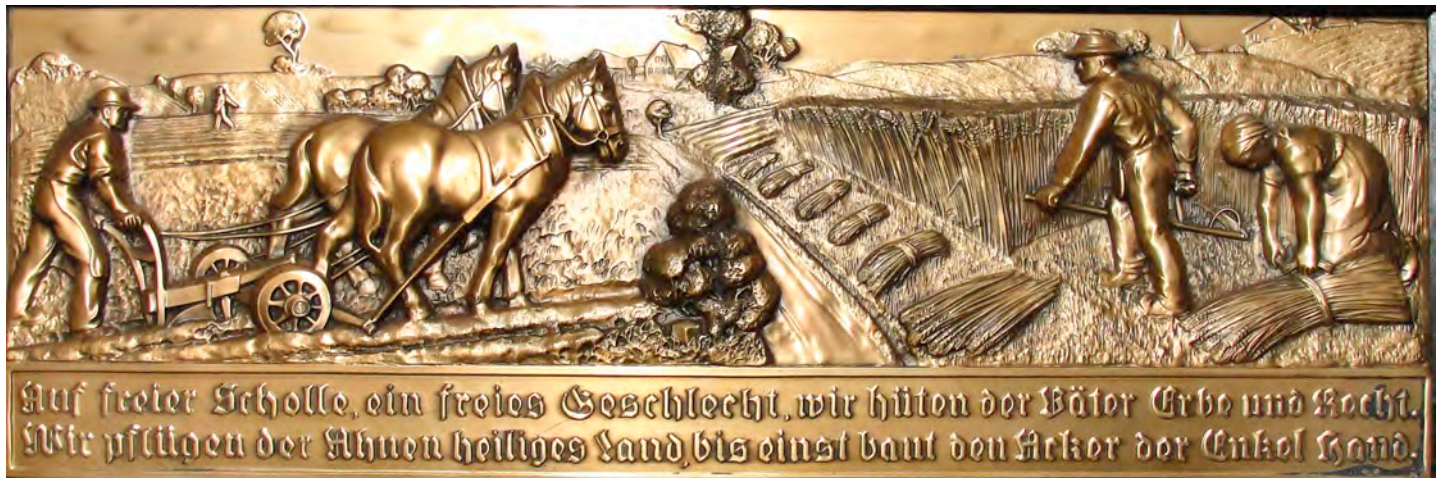
Dieser Kupferstich wurde dem Landwirtschaftlichen Verein 1958 für seine Verdienste überreicht, die er sich bei der Förderung der Region erworben hat.

Bereits in der letzten Ausgabe unserer Dorfzeitung berichteten wir von dem teilweise missionarischen Tätigkeitsdrang des Vereins. Heute beleuchten wir u.a. wie der Verein seine Aufgabe gemäß § 1 seiner Statuten "... die Landwirtschaft zu heben und zu fördern ..." gerecht wurde.