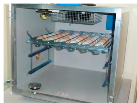
Der Brutautomat - bereits zur Hälfte befüllt

Dieses Profigerät wendet die Eier kontinuierlich, sehr langsam, also schonend, zwölf mal in 24 Stunden. Entsprechend kostspielig war die Anschaffung.