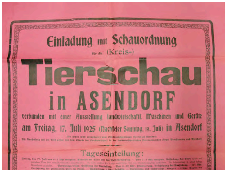
In der Einladung heißt es: Die Ausstellung soll ein Bild geben von dem Stande der Landwirtschaft in den landwirtschaftlichen Vereinsbezirken Bruchhausen, Hoya und Asendorf

Die Frage der Notwendigkeit des Auswanderns wurde bereits 1870 vom Landwirtschaftlichen Verein Asendorf ganz entschieden verneint. Waren doch bereits in den 60 und 70 ziger Jahren des 19. Jahrhunderts viele 2. Landwirtssöhne, Knechte, Mägde und vereinzelt auch ganze Familien nach Amerika ausgewandert, um sich dort eine bessere Lebensmöglichkeit zu suchen.