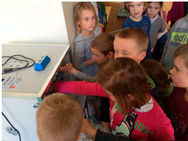
Das Einsetzen in den Automaten ist eine besonders begehrte Aufgabe