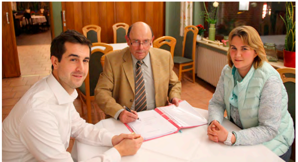
Der Vollzug des Verwaltungsaktes in den Räumen des Gasthauses Uhlhorn in Asendorf

Durch die Mitgliedschaft zum neu gegründeten Förderverein Fußball und zum bestehenden Förderverein der Sparte Handball kann jeder Bürger ein Unterstützer werden.