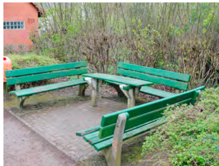
Diese Sitzgruppe erhält die Kennung "BV 261" "BV 262" und "BV 263"

Nach dem Vorbild, wie es bereits im letzten Jahr in Syke und Umgebung aufgebaut wurde, sollen auch für unsere Samtgemeinde in einem Kataster alle bekannten, öffentlichen Ruhebänke gelistet werden. Dazu werden die Standorte der einzelnen Bänke auf einer Karte zusammen geführt, die Bänke aufgesucht und mit einem Nummernschild versehen, Fotos von der Bank gemacht und die GPS-Positionsdaten gespeichert. Diese Positionsdaten stehen dann vorrangig unserem Rettungsdienst zur Verfügung.